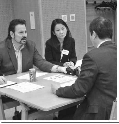
海外バイヤーと大阪市内企業との商談の様子。

海外からバイヤーを招き、大阪市内企業との海外販路開拓を目的とした「海外バイヤー商談会@東大阪」が、2月15日(火)から16日(水)の2日間にわたって、東大阪市のホテルで開催された。 この商談会には、海外バイヤーとして、コリアン・ユアテック(韓国)、エム・エス・エス(台湾)の2社が参加し、大阪市内企業と対話を交わした。東大阪市長の挨拶や、大阪市の紹介ビデオの視聴も行われた。 この商談会は、東大阪市の海外販路開拓を支援する「海外販路開拓支援センター」が主催している。