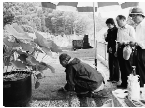
7月1日に行われた納骨式の様子