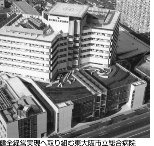
早期健全経営実現へ取り組む東大阪市立総合病院

東大阪市立総合病院は、PCC(包括診療報酬)の導入、患者7人に対して1人の看護師を配置する7対1看護の導入などを実現