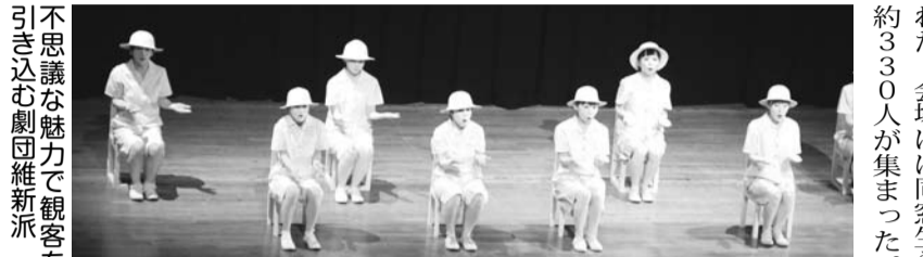
70周年記念祝賀会が開かれた。会場には同窓生ら約330人が集まった。