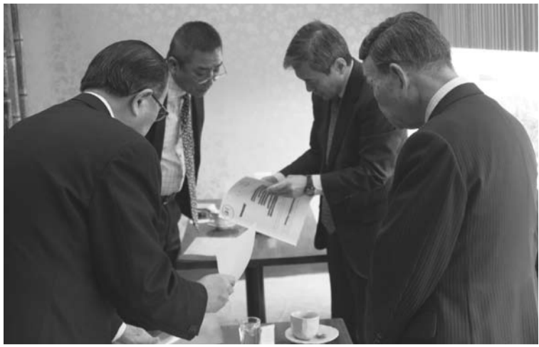
貰った告訴状コピーを手渡す男性(左手前)と受け取る島川副署長