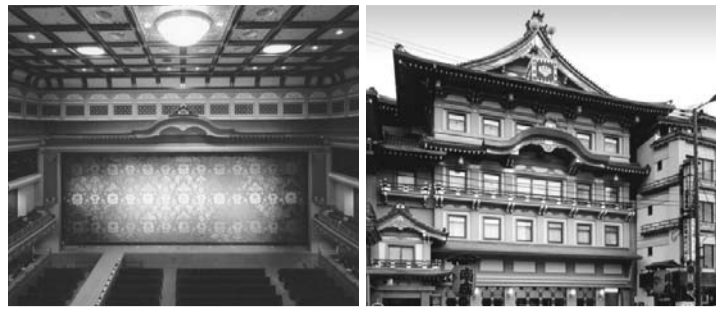
阿国かぶき発祥四百十年

大阪府枚岡署刑事課 者に漏らした件で、この 知能犯係に勤務していた 告訴状のコピーを貰った 警部補が、告訴状を第三 東大阪市の男性(66)が、