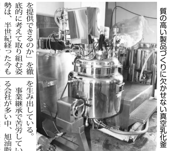
質の高い製品づくりに欠かせない真空乳化工

「お客様の課題は何か」「どうすれば最高の満足を提供できるのか」を徹底的に考えて取り組む姿勢は、半世紀経った今も変わっていない。何をおいてもお客様のニーズを第一に考えている。社は「誠意を持ってお客様のご要望にご信頼に応えたい」と、日々新たな業務を推進している。