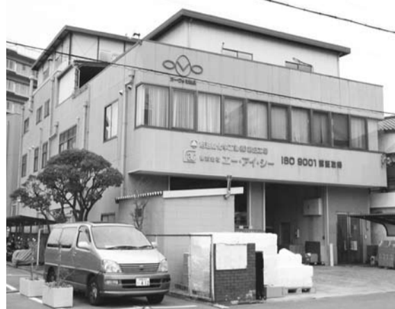
旭油脂化学工業株式会社第2工場および株式会社イー・アイ・シー