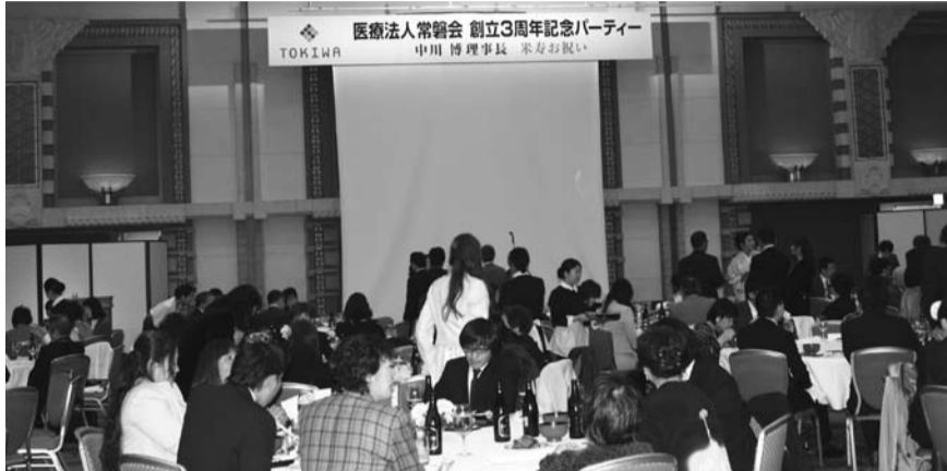
大盛会の創立3周年記念パーティー