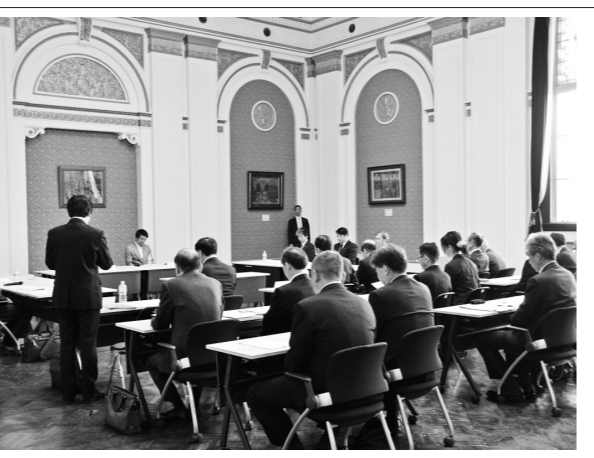
大阪市・八尾市・松原市の3市長が出席した設立準備委員会

あいの場「カワキタわくわく祭」を開催し、今年も開く予定です。今年、女性社員が中心となり、子どもたちが楽しめるようなイベントを開催する予定です。