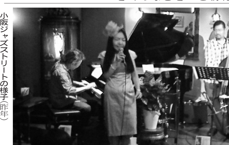
小阪ジャズストリートの様子(昨年)