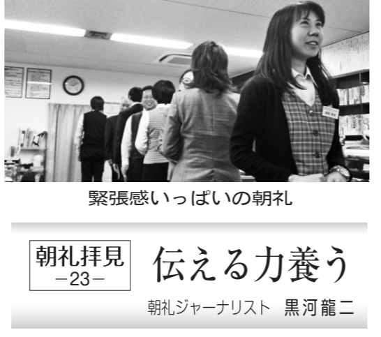
緊張感いっぱいの朝礼

東陽税理士法人の朝礼。朝礼は毎日9時から約15分間、身だしなみや服装のチェックから始まり、経営理念・行動指針の振り返り、そして、顧客への挨拶が中心となる。