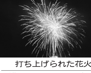
打ち上げられた花火

大きな音が立ち上り、その周りに夜店が設けられ、来場者を楽しませた。河内音頭の演奏が音頭取りに合わせて、午後7時50分頃から花火が始まった。色とりどりの花火が上がる度に、歓声が上がった。