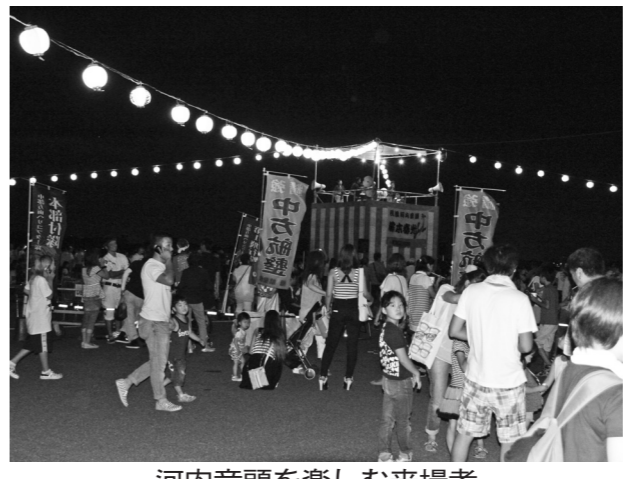
河内音頭を楽しむ来場者

大きな音が立ち上り、その周りに夜店が設けられ、来場者を楽しませた。河内音頭の演奏が音頭取りに合わせて、午後7時50分頃から花火が始まった。色とりどりの花火が上がる度に、歓声が上がった。