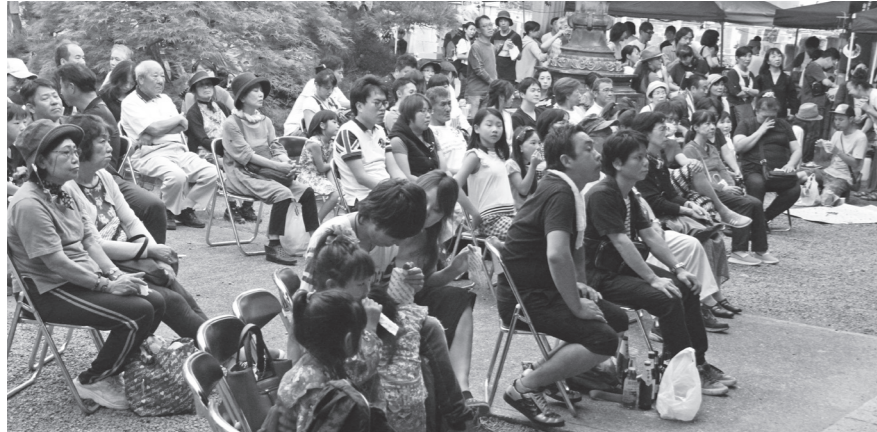
熱心に演奏を聞く参加者

快晴の下、9月25日にオクトバーフェスト「絆ライブ」が久宝寺御坊顕証寺(八尾市久宝寺4-4-3)で開かれた。オクトバーフェストはドイツで盛んに開催されているビール祭り。近年、日本の各地でも開催されているが、八尾では初めて、参加者は世界のビールを飲みながら、屋台の味を楽しんだ。