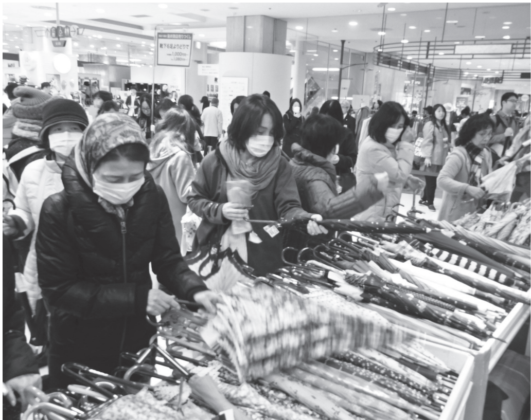
最終閉店売しつくして賑わった店内