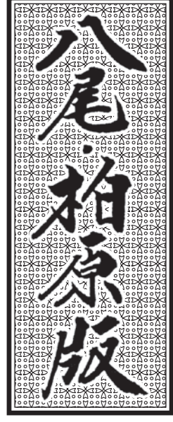
八尾柏原支社 八尾市山本町南6-2-29 TEL 072-926-5134 FAX 072-921-6893