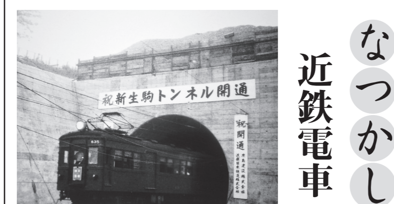
《新生駒トンネル開通後》 撮影時期 昭和39年8月ごろ 撮影場所 近鉄石切駅北側ホームから

Gallery Koyodo は近鉄大阪上本町駅から南へ徒歩5分。手作りのアクセサリー、かわいいストラップ、羊毛フェルトなどの新作の販売もあります。