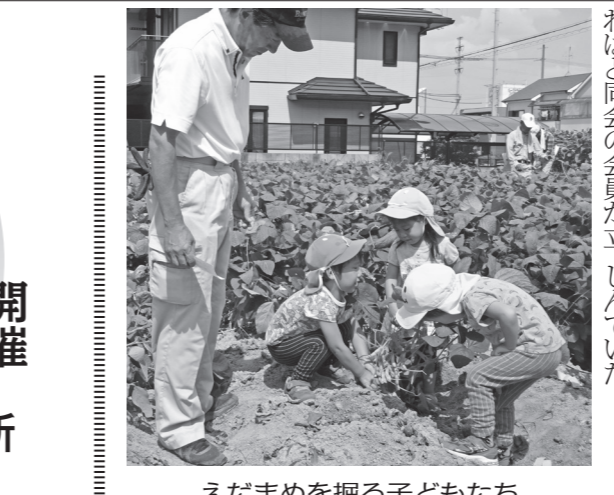
えだまめを掘る子どもたち