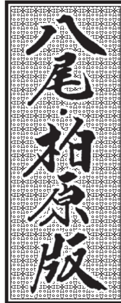
八尾柏原支社 八尾市山本町南6-2-29 TEL 072-926-5134 FAX 072-921-6893