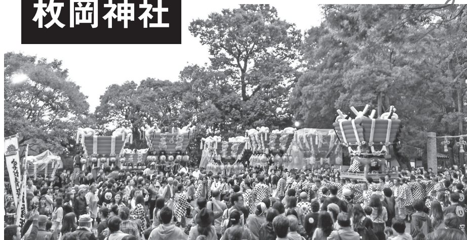
布団太鼓の宮入り

ご鎮座2680年の奉祝大祭を滞りなく終えた枚岡神社に秋が来た。10月の14〜15日の2日間、大阪府下で最大規模の秋祭り「枚岡神社秋郷祭」が賑々しく開催された。秋の実り・収穫を喜び五穀豊穡に感謝して、枚岡大神に報謝の気持ちを捧げるために昔より行ってきた祭りだ。