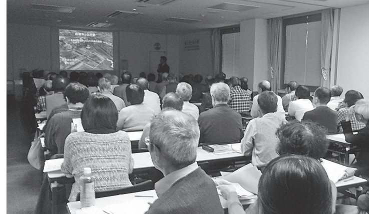
熱心に聞き入る歴史愛好家たち

なつかしい写真 昭和33年7月ごろ 撮影場所 国鉄天王寺駅構内にて(天王寺駅構内がまだありません) 今年も秋がないような感じで相当に体調不良を起こしている方が多く、私もその1人に入ります。特徴としては、眼のかゆみやくしゃみやだるさというアレルギー症状です。さて、今回は、大阪環状線の市電が全面廃止されたので、それ以前の城東線時代の写真とします。なつかしの大阪環状線(城東線時代)のもの。大阪環状線は、昭和36年4月に全線が一周できるように開通。それまでは、城東線・西成線と呼ばれていた。この電車は、戦前に製造されたもので電車の色は、こげ茶色でありました。当時、国鉄では戦前の鉄道省からの決まりで黒色・こげ茶色・緑色などでありました。これは、戦争になるとわかりづらいうえと決めていたと考えられます。現在のようにカラフルな色になったのは、昭和30年以降の高度成長期からです。