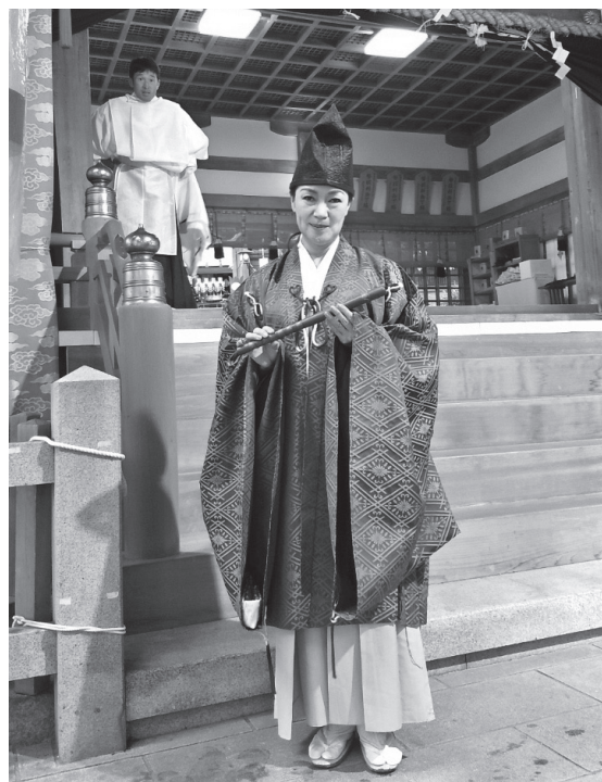
神幸行列に参加の女性

大中小23基の布団太鼓が、雲井・額田・宝積・豊浦・喜里川・五条・客坊・河内・四條の9地区を巡り順番に宮入りし、3台の地車が地域を曳り回る。秋の祭りの大太鼓が宮入奉納の様は、布団太鼓の太鼓の乗り手が打ち鳴らす太鼓や鐘の音、担ぎ手の「チヨウサー」の掛け声、参詣者の溢れる熱気は枚岡山に鎮座する淡路地区に担がれる大太鼓の飾り止車の宝を深めていく。氏子総祭りに欠かせないのが夜店だ。300店を超す夜店が境内・駐車場を所狭しと埋め尽くす。更に枚岡駅から次