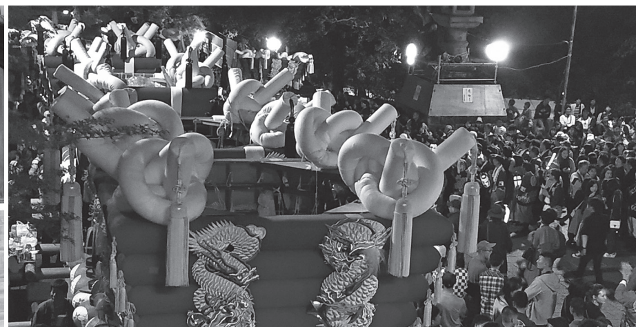
縛り紐は沸き立つ雲