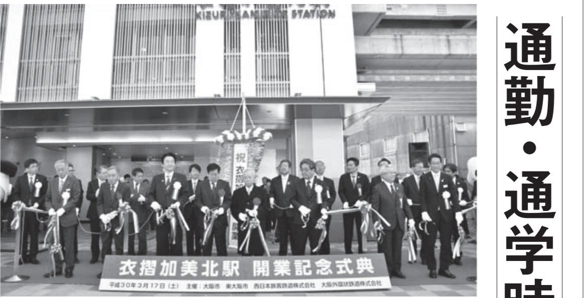
晴天の下、地域の名士らがテープカット