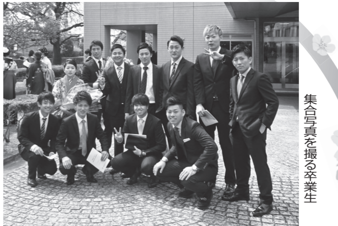
集合写真を撮る卒業生

代書屋さんと親しく呼ぶ行政書士の皆さんが「行政書士記念日」の2月22日、ゆうちょ銀行八尾店(八尾市陽光園1-5-15、川清商店長)で無料相談会を実施した。この記念日は行政書士会が昭和26年2月22日公布されたこと由来する。その記念行事として昨年から、大阪府行政書士会がゆうちょ銀行と連携し、相談遺言の手続きなどの無料相談会を行っている。一方、ゆうちょ銀行は顧客サービスの一環として第2の人生設計・資産運用などの相談にも応じる。