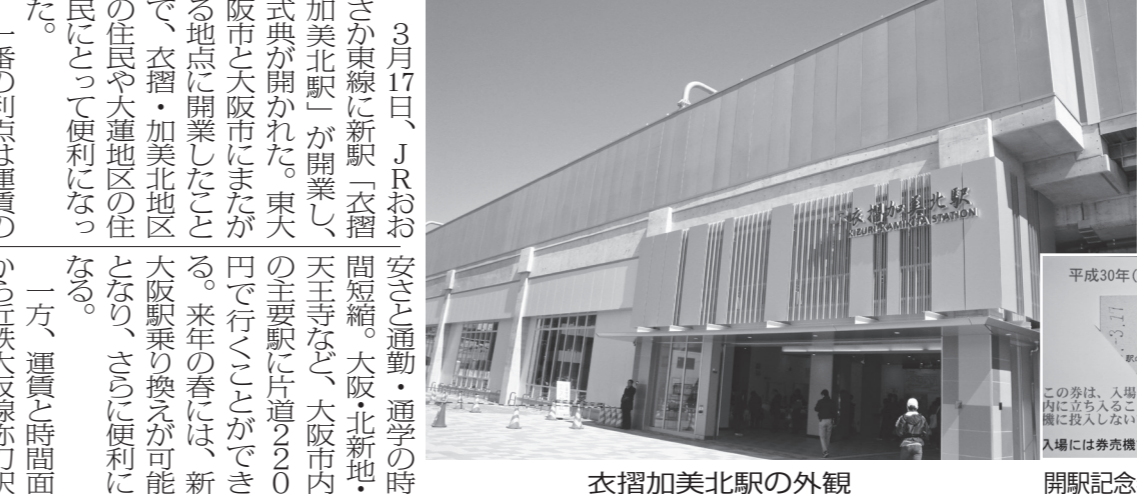
衣摺加美北駅の外観 開業記念券

3月17日、JRおおさか東線に新駅「衣摺加美北駅」が開業した。大阪市内の主要駅に片道220円で行くことができる。来年の春には、新大阪駅への乗り換えが可能になる。