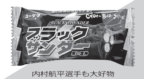
内村航平選手も大好物

「有業製菓株式会社が、黒糖を使用した「ブラックサンダー」を生み出したのは1994年。今から24年を遡る。河合さんが経営に就いての本を読み漁っていたときに、ランチエスター戦略に出会った。簡単に言えば、チョコレートとオレンジを組み合わせるという教義。そのようにチョコレートの硬さを落とすという発想が、ブラックサンダーを生み出した。同社にとっては新たなチャレンジャーだった。製造を始めたら飛ぶように売れた。しかし10円や20円に値下りし、今までは100円の菓子を売っていたのが、10円ばかりでは仕方ないだけだ。生産金額が上がる。つまり、売上が上がらない。だから、集金に行く」と商品を納めた分だけ回収できた。