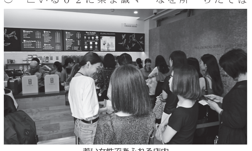
若い女性であふれる店内