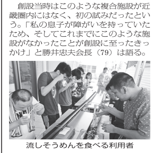
流しそうめんを食べる利用者

社会福祉法人ヤンググリーンは生活介護事業、就労支援事業及び就労支援移行事業の展開と共に、ケアホーム、ヘルパー派遣事業の運営もしている。3年前に創設されたエバーグリーン(東大阪市荒本1-4-32)は障がい者と高齢者の複合施設だ。この施設では1階が「ウィル」という障害者センター、2階は「はらっぱ」というデイサービスセンター、3、4階が「もみの木」というサービス付き高齢者向け住宅となっている。