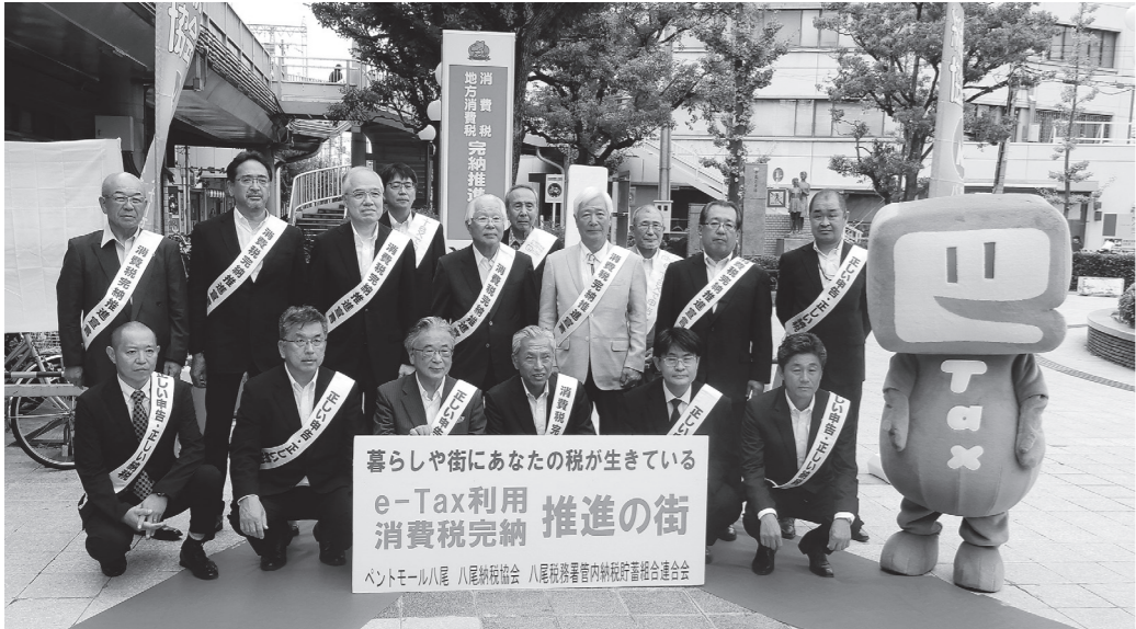
暮らしや街にあなたの税が生きている e-Tax利用 消費税込納 推進の街