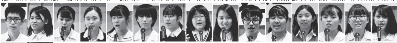
出場した高校生19人