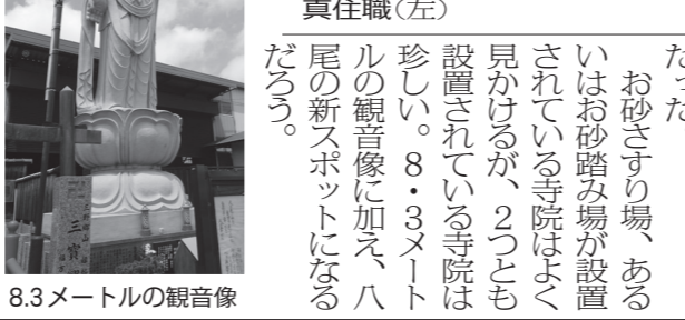
8.3メートルの観音像